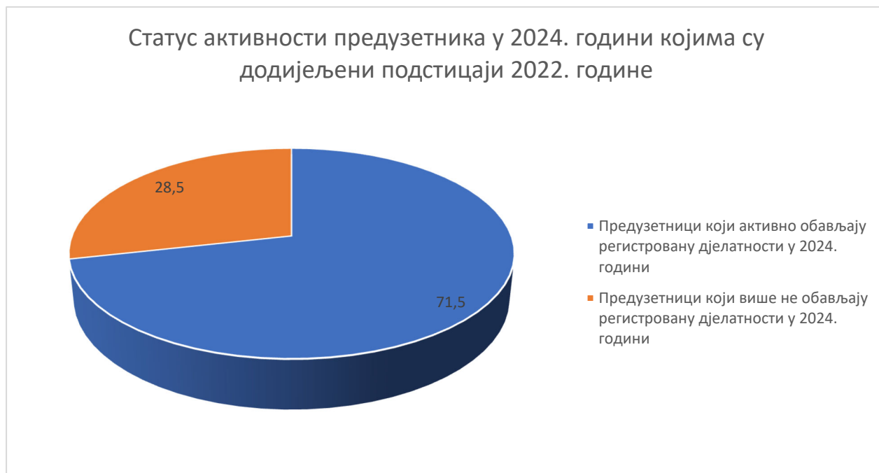
2.1.1. Графички приказ активних и одјављених предузетника којима су додијељени новчани подстицаји 2022. године

Изражено у процентима, 71,5% предузетника (пет од седам корисника) који су регистровали дјелатности послуже додјеле новчаних подстицаја за самозапошљавање у 2022. години активно обавља регистроване предузетничке дјелатности већ трећу годину.